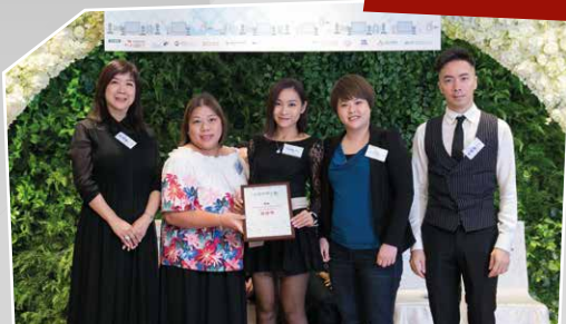
Aromas Breast Milk Accessories