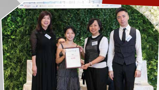
Green Accessory Gallery