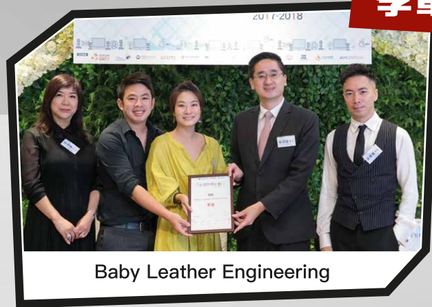
Baby Leather Engineering