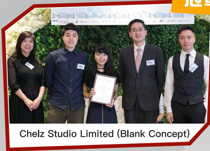
Chelz Studio Limited (Blank Concept)